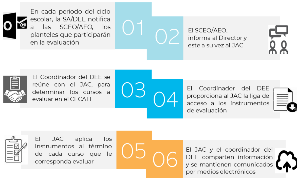
Gráfico 3. Proceso de aplicación de instrumento.