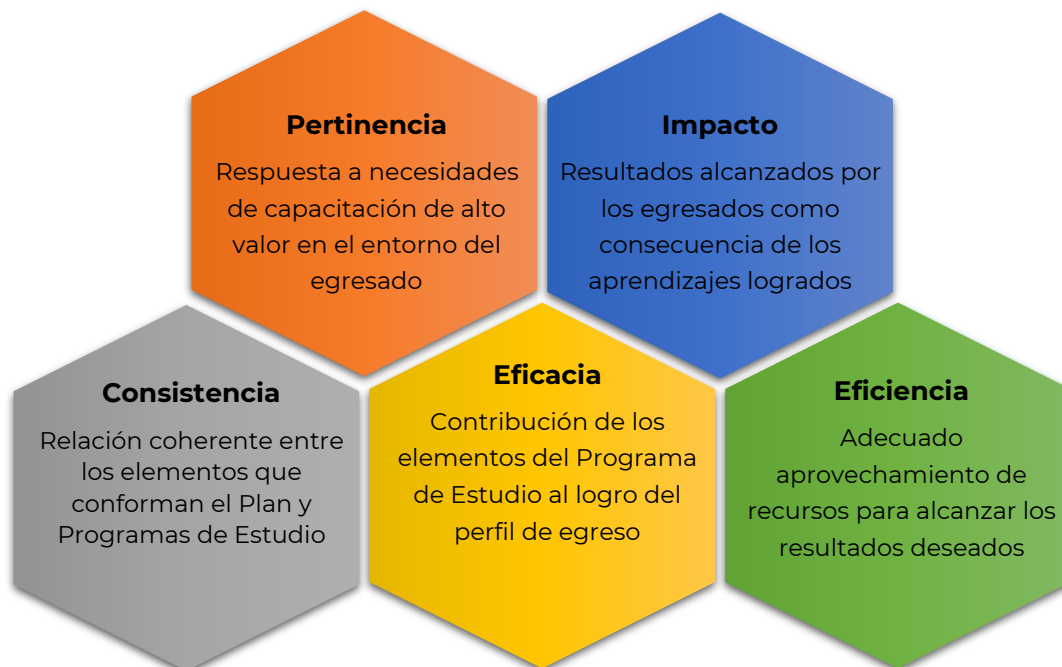
Gráfico 1. Criterios de la evaluación curricular en la DGCFT. Fuente: Elaboración propia a partir de DGCFT(2016). Guía metodológica para el diseño de planes y programas de estudio de formación para el trabajo

La Guía metodológica para el diseño de planes y programas de estudio de formación para el trabajo (DGCFT, 2016) , señala que a través de la evaluación de los PyP podemos conocer acerca de su diseño, operación y efectos formativos y, con base en ello, orientar su actualización o rediseño, considerando por lo menos cinco criterios: