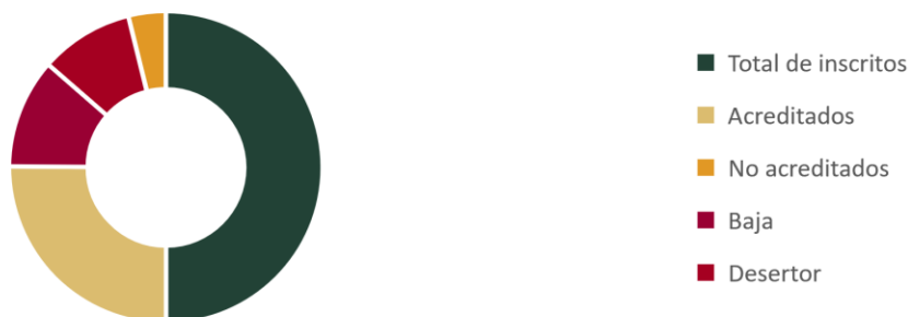
Capacitación presencial y a distancia